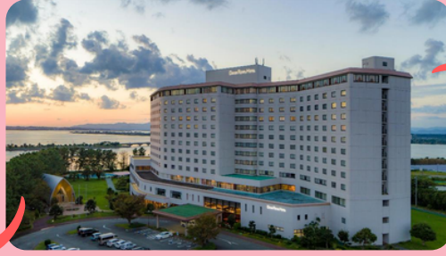
Aコース THE HAMANAKO