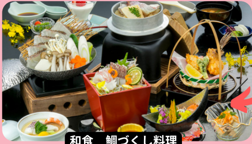
和食 鯛づくし料理