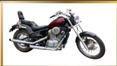
スティード400【ホンダ】