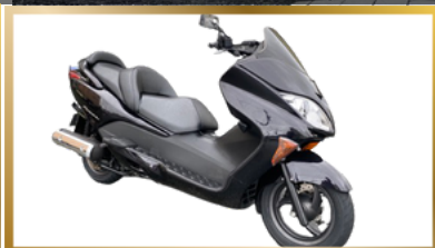
フォルツァ250【ホンダ】